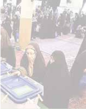
یک تصویر از یک صندوق رأی در تهران، ایران