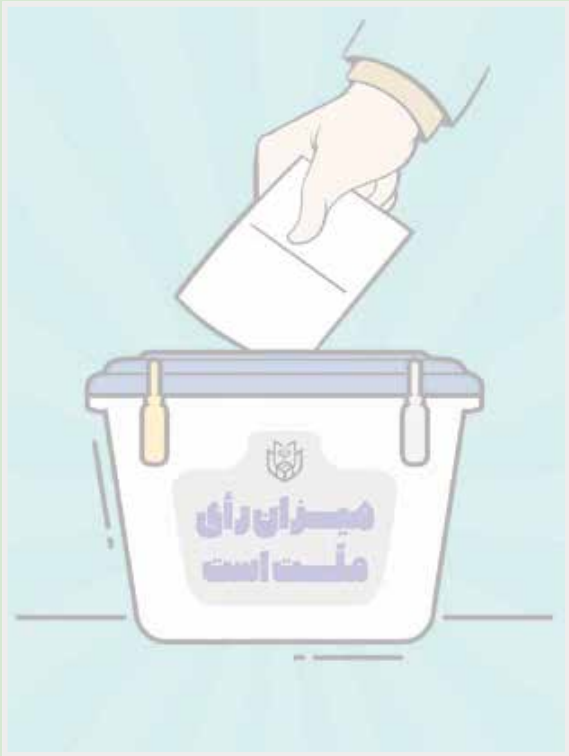
یک تصویر از یک صندوق رأی در تهران، ایران

هفته نامه داخلی سازمان صدا و سیما ی جمهوری اسلامی ایران